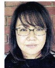
もりずみ ともこ 森泉 朋子